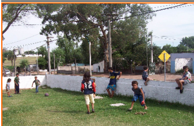
📍 Il cortile del centro