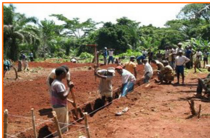
Alcune foto relative agli scavi effettuati dai "Muratori" di Babonde per la costruzione di un edificio