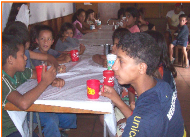
📍 La merenda "El merendero" al centro San Francisco